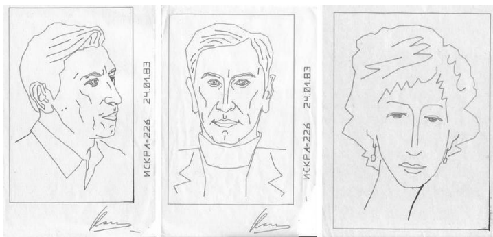
фото. 18. Показаны три линейчатых портрета, которые нарисовал компьютер ИСКРА-226, два портрета мои, один моей жены.

Хотя первоначально все неплохо начиналось, у нас в Ленинграде два американца организовали еще при Хрущеве лабораторию, где стали делать персональные приборы даже раньше американцев. Это было при Хрущеве и он это поддерживал. Но когда Хрущева сняли и пришел Брежнев, он лабораторию распустил, а развитие микроэлектроники спустил на тормозах. В то время подмосковный Зеленоград уже строили, и его даже построили, но конкурентом силиконовой долины он не стал.