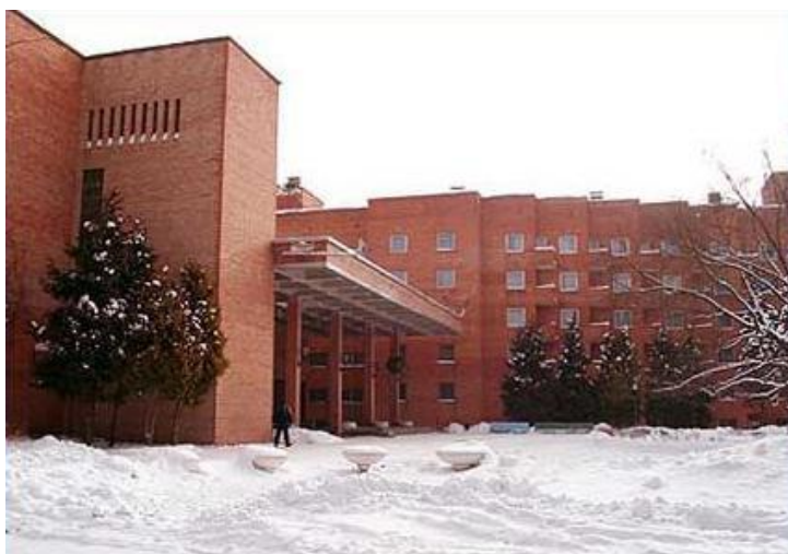
фото. 19. Вход в пансионат "Звенигородский" академии наук России.