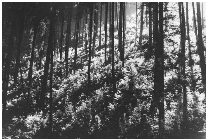
фото. 4. Снимок сделан в Карпатах во время перехода вдоль реки к озеру Синевир. Тогда цветные фотографии делать было сложно, приходилось искать красоту в черно-белом мире.

В мире много чудес и я для себя выработал такую тактику, что если я чего-то не вижу, не знаю или не понимаю, то для меня лично это не существует. И не стоит морочить себе голову проблемами, которые не имеют решения. Вполне достаточно интересных проблем, которые можно решить, вот этим и стоит заниматься. И, тем не менее, как человека любопытного, меня интересует все, что нафантазировано людьми, включая и чистую научную фантастику и религию и псевдорелигии типа эзотерики. Я готов с этим познакомиться и принять к сведению на всякий случай. Но лично со мной мистический случай произошел только один раз, именно на стройке Космоса. Был и еще один случай, но я опишу его позже.