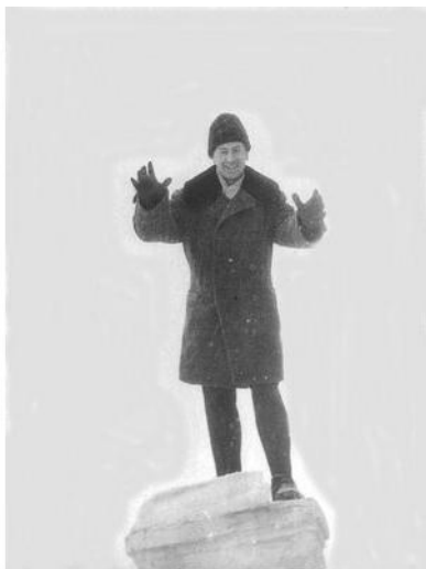
фото. 2. Левый снимок был сделан в фото-ателье, у профессионалов. Правый снимок – любительский и зимой. Вот в такой одежде я и ходил в старших классах школы.

Помню также, что я часто ездил в разные школы в составе сборной играть в волейбол на первенство то ли района, то ли города. А для соревнований на лыжах мне в школе даже выдали одну пару клееных лыж высокого качества, которые тогда очень дорого стоили. Ну