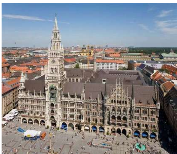
фото. 25. Снимок из интернета. Новая ратуша в Мюнхене, Германия. Я часто бывал на площади около нее.