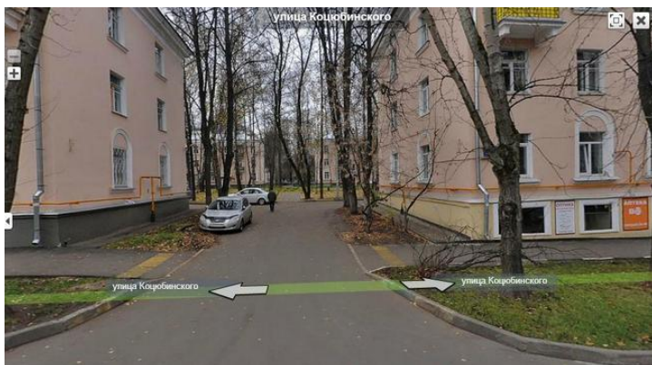
фото. 27. Вид на двор нашего дома на улице Козловского. На переднем плане слева дом 3 корпус 1, справа дом 5 корпус 1, на заднем плане слева дом 3 корпус 2, справа дом 5 корпус 2. Мы жили в доме 3 корпус 2.

быть еще меньше. Правда считается, что вероятность случайного события не зависит от предыстории, то есть от того, совершилось это событие раньше или нет. Но все таки есть же справедливость на свете. Почему одним два удара, а другим ни одного. Я свое уже получил.