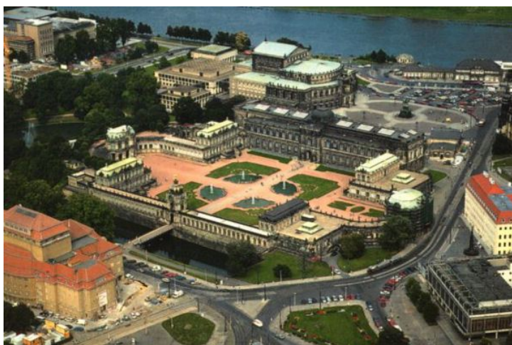
фото. 16. Вид сверху на знаменитый дрезденский Цвингер, своих фотографий у меня не сохранилось.

После семинара Хельмут мне сказал, что я зря тужился и рассказывал на английском языке. Мы у себя в лаборатории учим русский язык и даже иногда устраиваем семинары на русском. Ты мог бы говорить на русском языке. Но что сделано, то сделано, если бы он мне раньше сказал. Но вовсе не факт, что ребята бы поняли меня лучше. Вот интересно, что раз я решил все проблемы и у нас сотрудничество состоялось, то мне вовсе не нужно было каждый день ездить в институт.