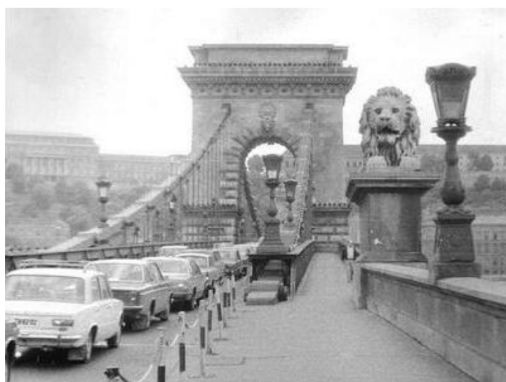
фото. 15. Знаменитый мост в Будапеште, на котором уже в 1981 году были пробки.