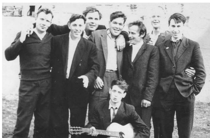
фото. 5. Снимок сделан в поселке Павда, во время моей работы там учителем в школе. Я стою справа, остальные люди тоже учителя, мы все находимся на пикнике в выходной день.

Одновременно со мной в поселок приехал парень после окончания Ярославского педагогического института, он приехал по распределению работать там надолго. Кажется его сразу поставили директором дневной школы, а может и через какое-то время, но быстро. Он был очень активный, любил выступать и что-то организовывать. Он был нормальный парень, но ничего интересного я не запомнил. Помню только один эпизод. По случаю какого-то праздника учителя его школы устроили пикник на природе и он меня тоже пригласил. Там я познакомился с интеллигенцией поселка. Популярным развлечением было стрелять из настоящего ружья по банкам. Я фактически первый и единственный раз пострелял из настоящего ружья. Ружья у них были у всех, в лесу водились медведи и разный другой зверь.