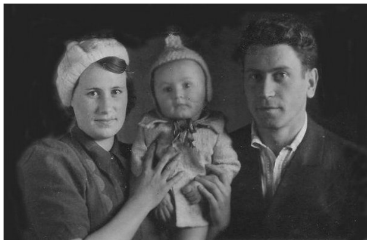
фото. 1. Слева моя мать, справа отец, а в середине я. Снимок сделан, наверно, в начале 1945 года, война еще не окончилась, но фотографии умели делать так, что до сих пор сохранилась.

бухгалтеров, все женщины. И ему дали неплохое жилье. Конечно в бараке, как всем эвакуированным, в то время в городе было очень много барачков. Но у нас был отдельный вход и три комнаты. На фоне своих соседей мы жили в лучших условиях. Ну а с питанием вообще не было проблем. Конечно у нас был сарай с дровами, мы топили печку, туалет был на улице, все как у многих в то время.